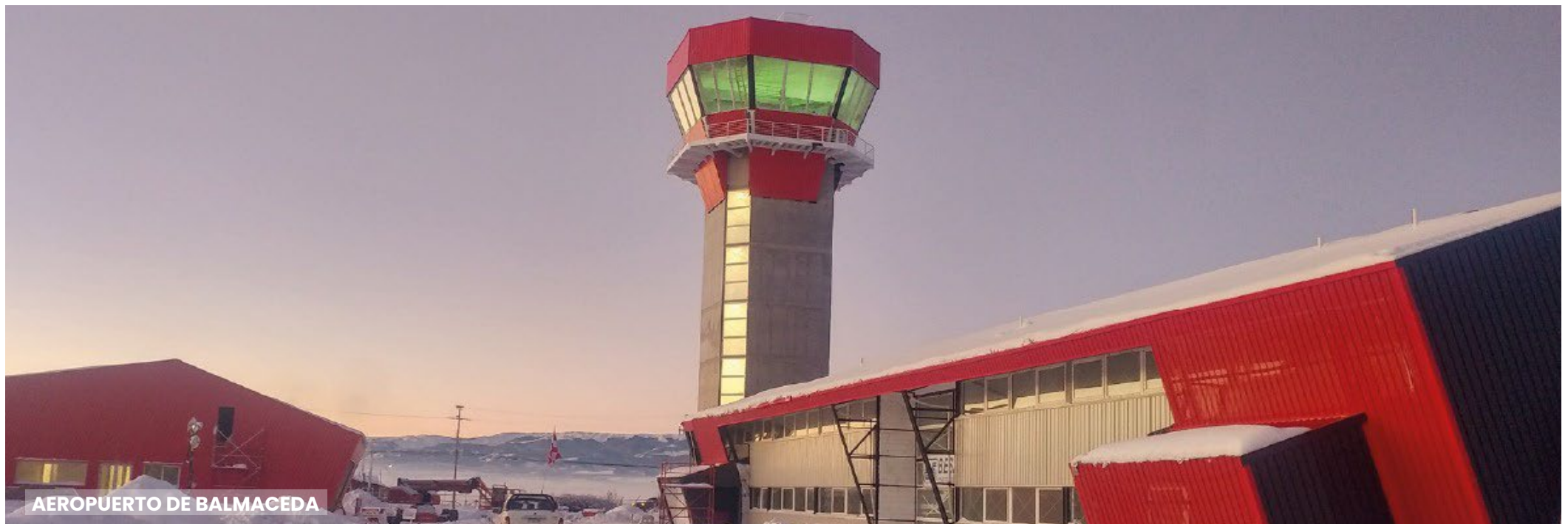
AEROPUERTO DE BALMACEDA