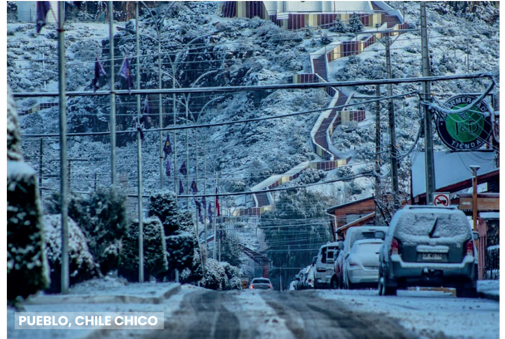
PUEBLO, CHILE CHICO