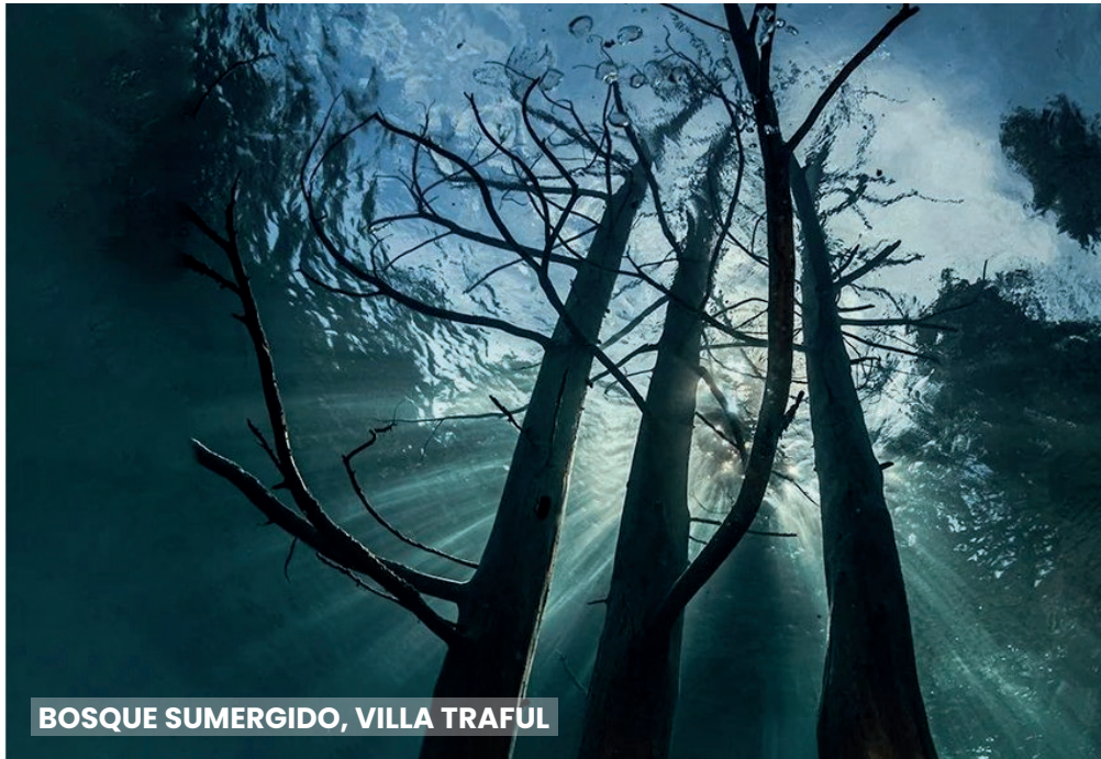
BOSQUE SUMERGIDO, VILLA TRAFUL