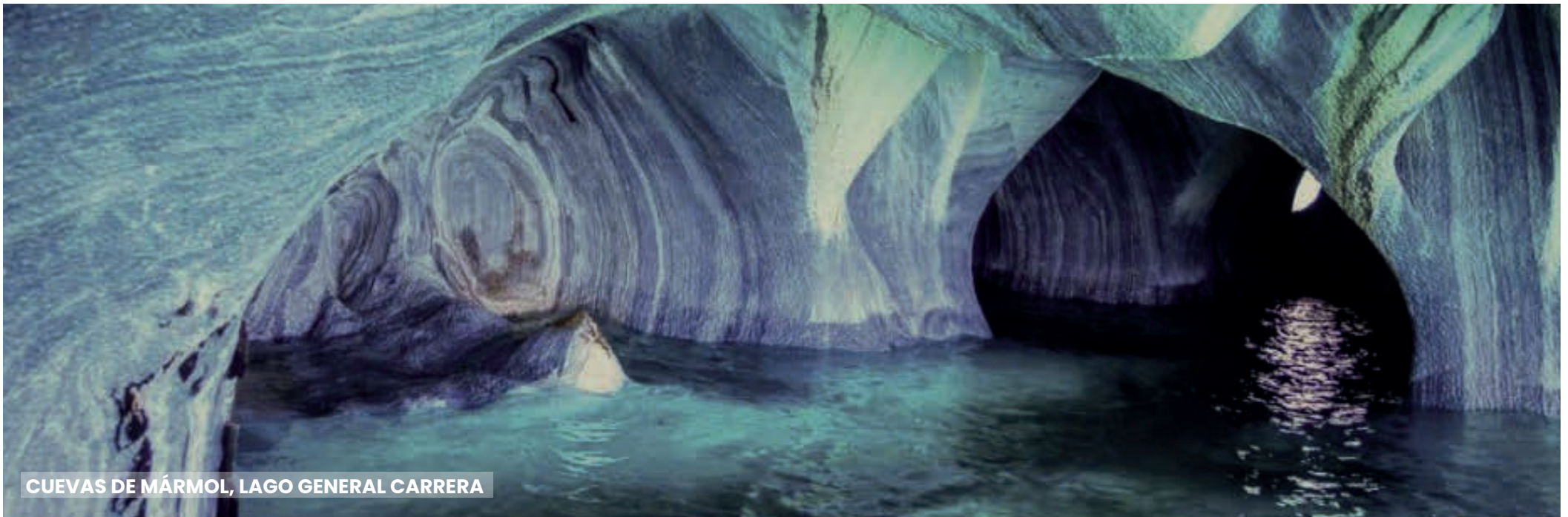
CUEVAS DE MÁRMOL, LAGO GENERAL CARRERA