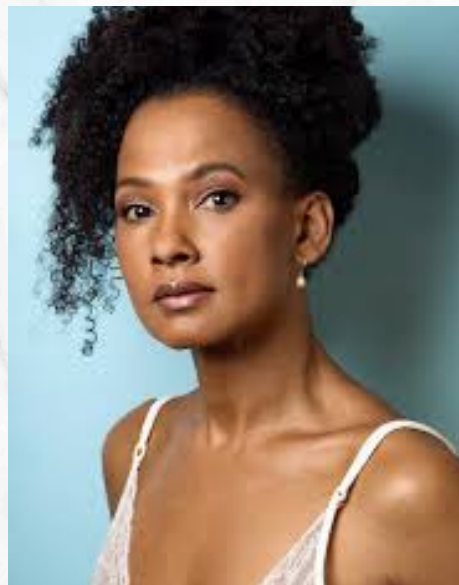
Indhira Serrano actriz barranquillaera, con larga trayectoria en la televisión colombiana