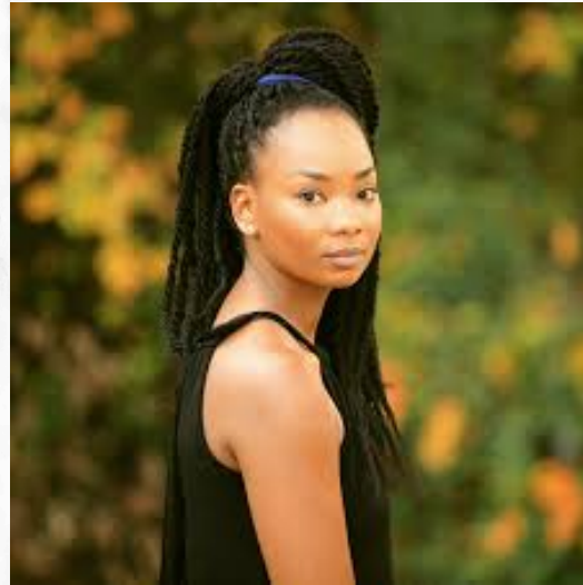
Karen Hinestroza , actriz colombiana, conocida por ser la protagonista de “La mamá del 10”